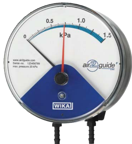
Манометр дифференциального давления air2guide P Модель A2G-10