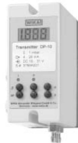
Преобразователь давления Модель DP-10